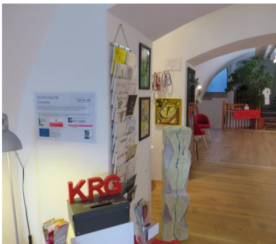
Poster immer im Projektbüro