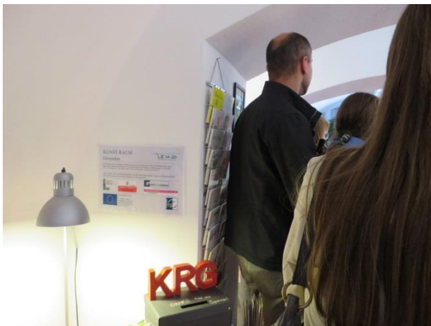
Poster im Innenbereich bei VA