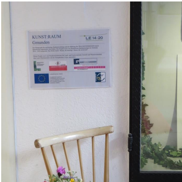
Poster im Außenbereich